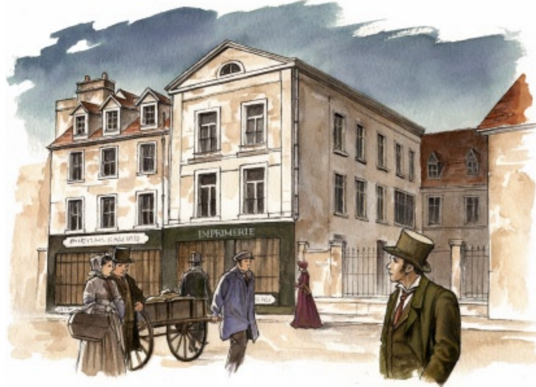
Imprimerie Poulet-Malassis à Alençon