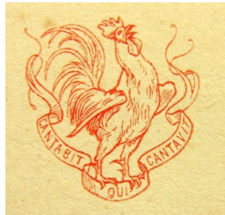
L'une des nombreuses marques de Poulet-Malassis

Pour règle de vie, Poulet-Malassis suivait sa maxime favorite : Il faut toujours garder sa gravité avec les sots. L'éditeur suivait ce principe : Il vaut mieux des livres qui ne se vendent pas que des auteurs qui se vendent. Le ton adopté par Charles Monselet dans une